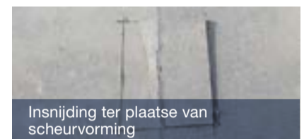
Insnijding ter plaatse van scheurvorming