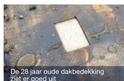
De 28 jaar oude dakbedekking ziet er goed uit

De prestaties blijven uit en het is inmiddels al weer 28 jaar geleden dat we met ons Nederlands elftal een prijs pakten. In 1988 werd wel met het juiste systeem en een goede samenwerking een prestatie van wereldklasse -of misschien beter- Europese klasse neergezet. Wij (onze jongens) werden Europees kampioen.