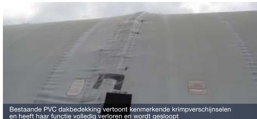
Bestaande PVC dakbedekking vertoont kenmerkende krimpverschijnselen en heeft haar functie volledig verloren en wordt gesloopt

Voor de vakantieperiode is gestart met de werkzaamheden. Zie de foto's voor een impressie van de vorderingen tot nu toe.