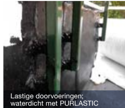
Lastige doorvoeringen; waterdicht met PURLASTIC

Daarnaast wordt het toegepast als waterdichting en oppervlaktebescherming van beton, bijvoorbeeld bij oude civiele kunstwerken en afdekkers van bijvoorbeeld schoorstenen. PURLASTIC is een ééncomponente, vloeibare polyurethaan-bitumen dakbedekking. Het is een thixotroop product, dat garant staat voor een gemakkelijke verwerking bij een grote laagdikte (tot 1 mm in één laagdikte). De dikte van het aangebrachte product zal na uitdroging niet teruglopen. Ook zal het aangebrachte product zijn elasticiteit voor lange tijd behouden. Het product droogt door de luchtvochtigheid en hecht uitstekend aan bitumen. Het eindproduct heeft een hoge chemische, dynamische en Liv-bestandheid.