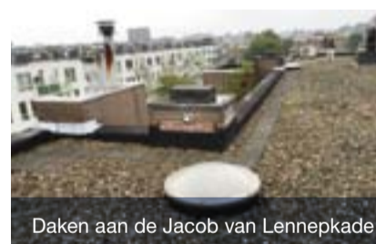
Daken aan de Jacob van Lennepkade