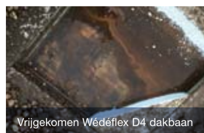
Vrijgekomen Wédéflex D4 dakbaan