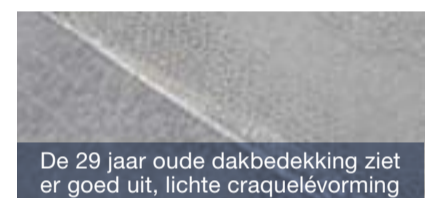
De 29 jaar oude dakbedekking ziet er goed uit, lichte craquelévorming