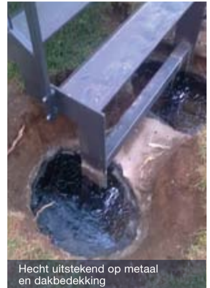
Hecht uitstekend op metaal en dakbedekking

Dit maakt het product een prima probleemoplosser. Lastige dakdetails die met dakbedekking niet zijn te maken, kunnen eenvoudig met dit product voor lange tijd waterdicht worden gemaakt.