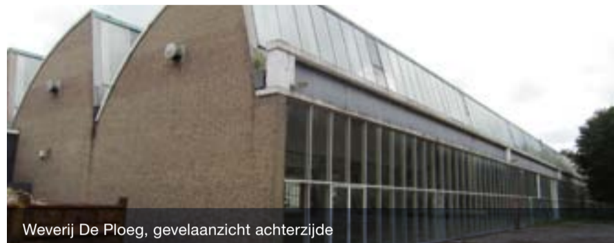
Weverij De Ploeg, gevelaanzicht achterzijde