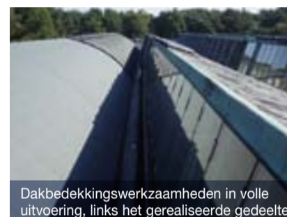
Dakbedekkingswerkzaamheden in volle uitvoering, links het gerealiseerde gedeelte

De PVC dakbedekking vertoont de kenmerkende krimpverschijnselen en heeft haar functie volledig verloren. Deze PVC dakbedekking wordt dan ook volledig gesloopt. Buro Franken heeft uit historisch onderzoek geconcludeerd dat de toepassing van een bitumineus dakbedekkingssysteem in de voor Rietveld kenmerkende