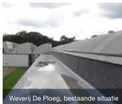
Weverij De Ploeg, bestaande situatie