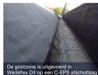
De gootzone is uitgevoerd in Wédéflex D4 op een C-EPS afschotlaag

verticale belijning het meest passend is. De kleur van natuur leislag is ook de oorspronkelijke kleur. In overleg met Lex Burgmans Bouwbegeleiding is besloten de dakbedekking mechanisch bevestigd aan te brengen. Daartoe is in overleg met Van Roy Fasteners VRF een geschikt type bevestiger gekozen, die in de dunne schaal van beton kan worden aangebracht met een boordiepte van slechts 40 mm. De gootbodems van de sheds zijn voorzien van een C-EPS afschot isolatiemortel, waarop een tweelaags Wédéflex D4 systeem is aangebracht.