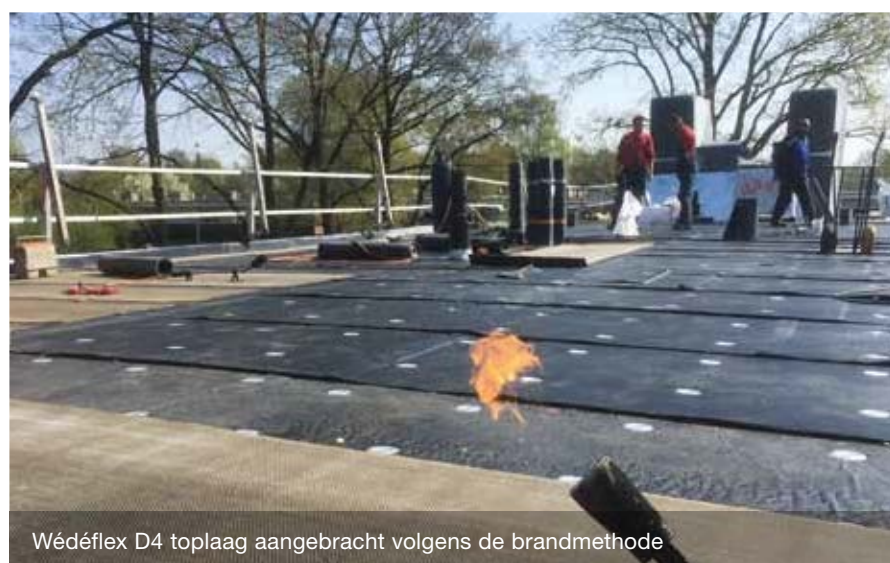
Wédéflex D4 toplaag aangebracht volgens de brandmethode