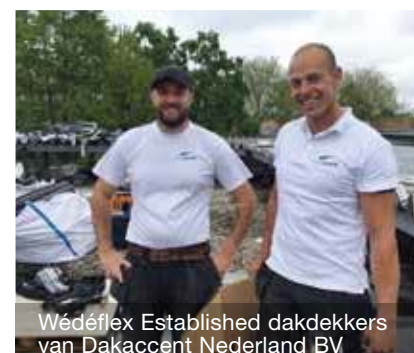
Wédéflex Established dakdekkers van Dakaccent Nederland BV