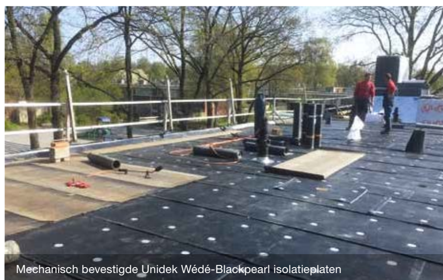
Mechanisch bevestigde Unidek Wédé-Blackpearl isolatieplaten

Alle partijen zijn enthousiast over de samenwerking, de bewoners hebben geen klachten en de dakdekkers zijn lovend over de Unidek Wédé-Blackpearl. Tot op heden halen we de planning die vooraf is opgesteld op de dag nauwkeurig en loopt alles volgens plan. Een groot compliment voor alle uitvoerende partijen en de leveranciers.”