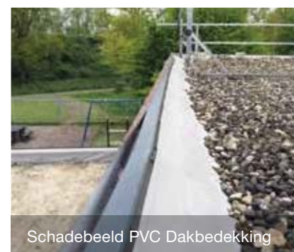
Schadebeeld PVC Dakbedekking

Stichting KPO kan wederom terugkijken op een professioneel aangepakte dakrenovatie waardoor de mensen bij BS De Kameleon straks tot in lengte van jaren kunnen genieten van nieuwe, zorgeloze en lekkagevrije daken.