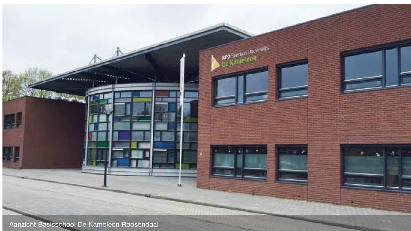
Aanzicht Basisschool De Kameleon Roosendaal

De Kameleon in Roosendaal is een school voor bijzonder onderwijs (SO en VSO). Als onderdeel van Stichting KPO biedt deze school onderwijs aan kinderen met een verstandelijke beperking in de leeftijd van 4 tot 20 jaar. Stichting KPO (Katholiek Primair Onderwijs) fungeert als koepel voor 18 basisscholen en biedt speciaal onderwijs aan 4200 leerlingen in de regio West-Brabant.