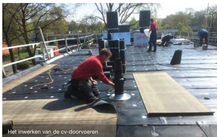
Het inwerken van de cv-doorvoeren