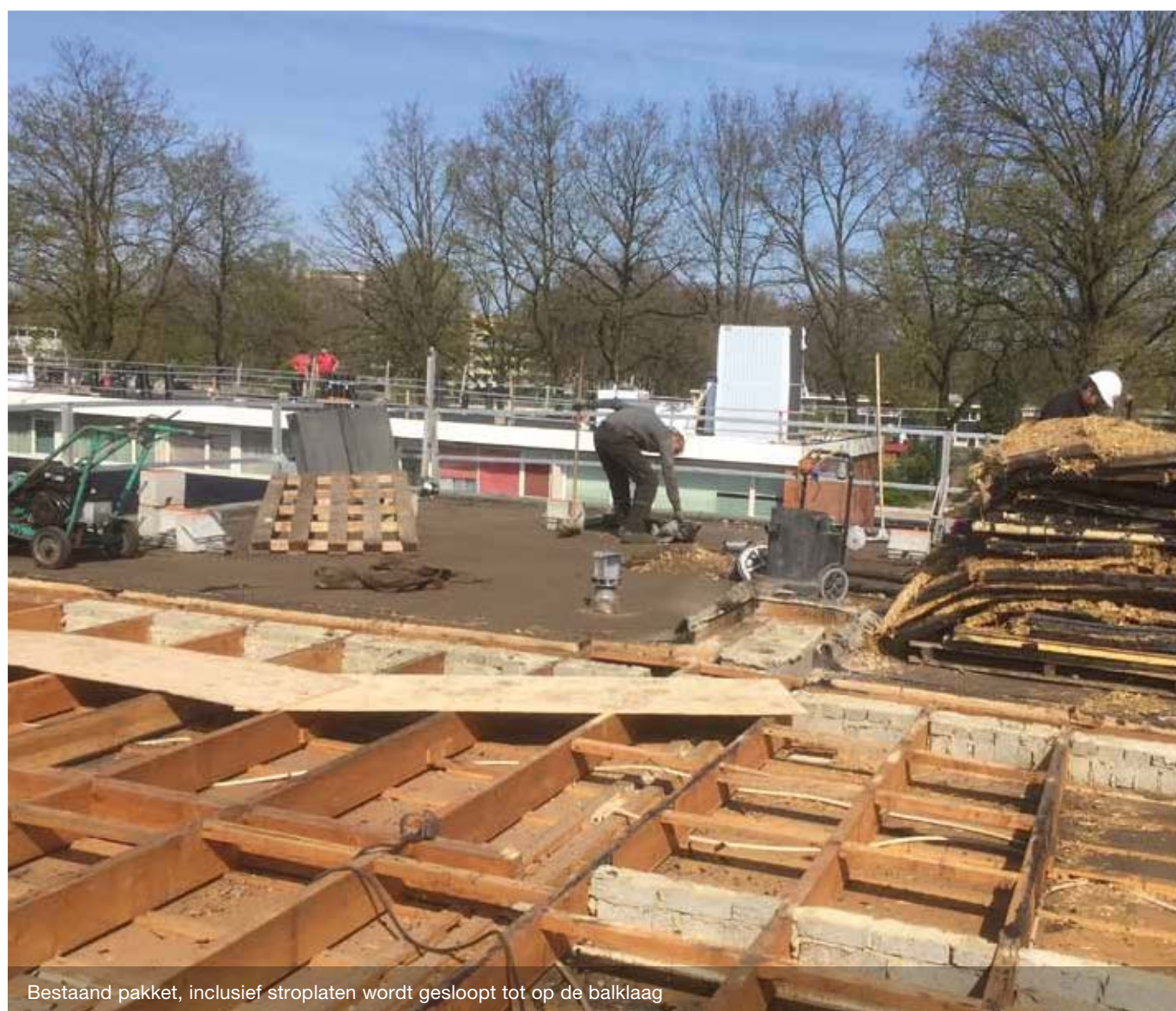
Bestaand pakket, inclusief stroplaten wordt gesloopt tot op de balklaag