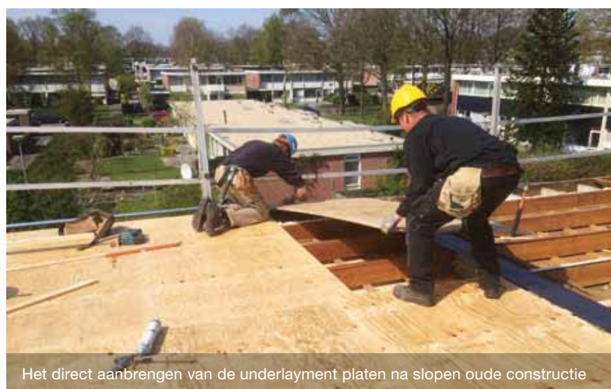
Het direct aanbrengen van de underlayment platen na slopen oude constructie

Hoe groter de uitdaging, des te groter de voldoening wanneer het lukt. Onmisbaar hierbij zijn ingrediënten als voorbereiding, goede materialen en betrokkenheid. De renovatie van 182 woningen in woonwijk Angelslo te Emmen is een uitdaging van formaat en bevat de benodigde ingrediënten.